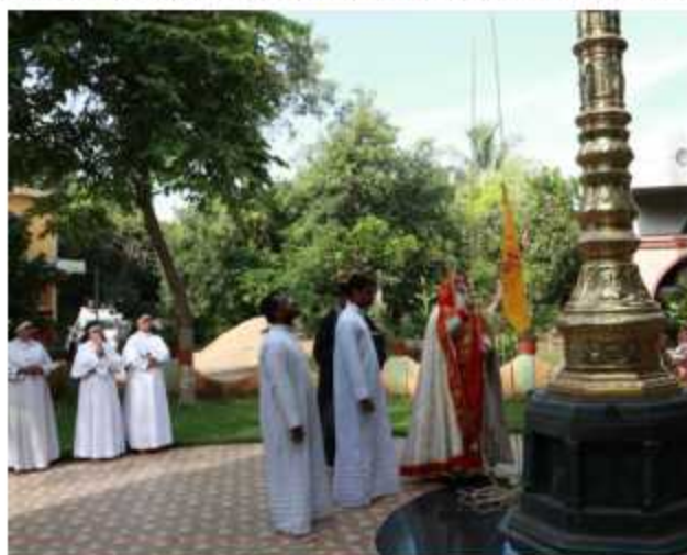
108 th Anniversary Celebration of Establishment of Catholicate at St. Thomas Mission, Bhilai